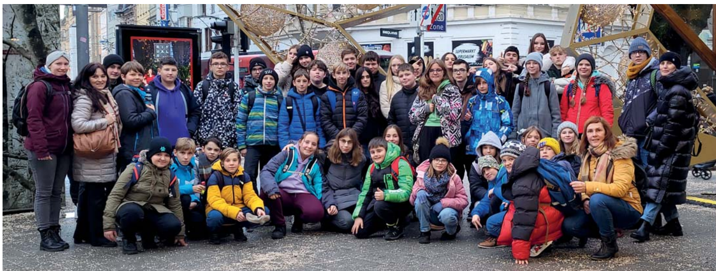
Exkurze do rakouského Linze