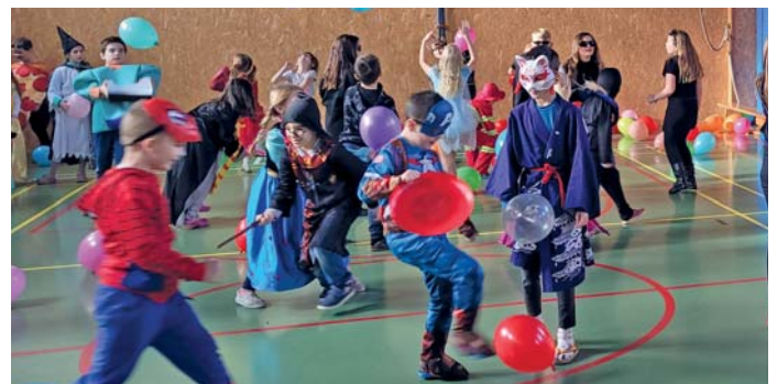
Maškarní rej v tělocvičně