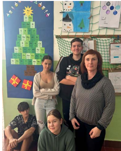
Chemický vánoční stromeček

Vánoční svátky jsme si užili v kruhu svých blízkých a v lednu to opět rozjeli.