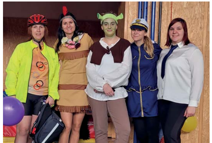
Maškarní ZŠ – učitelský sbor