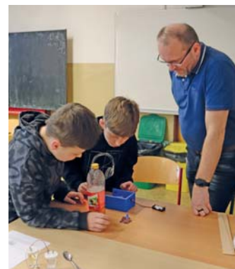
Den otevřených dveří